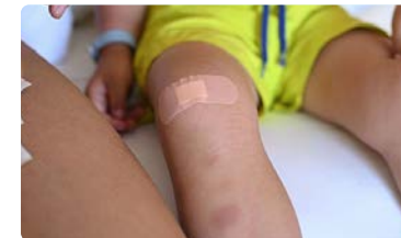
¿Es segura la vuelta al Colegio sin enfermeras escolares?