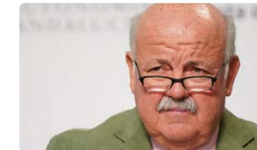
El consejero de Salud y Familias, Jesús Aguirre, responde a la carta emitida por el CAE