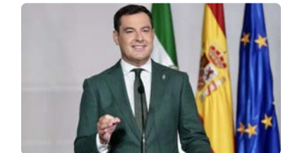
Posicionamiento de las enfermeras andaluzas ante las declaraciones de Juan Manuel Moreno, presidente de la Junta