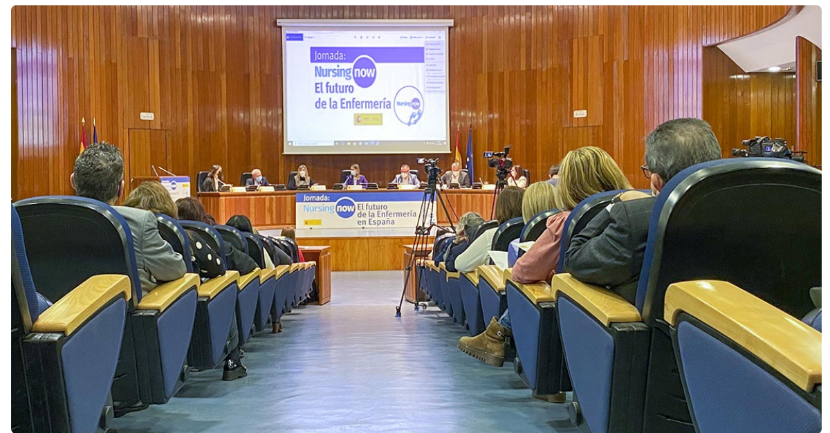
La jornada se pudo seguir en streaming y de forma presencial

Además de adaptar la plaza de enfermeras a las ratios que actualmente tiene Andalucía, logrando los estándares de calidad que desde la Unión Europea se establece como necesario para la seguridad y calidad asistencial ofrecida al paciente. En definitiva, mayor reconocimiento, liderazgo y oportunidades de desarrollo en todos los niveles de enfermería. “Se hace necesario implicar a las Administraciones para que conozcan aquellos ámbitos dónde la enfermería puede tener un mayor impacto, qué impide que las enfermeras alcancen todo su potencial y cómo abordar estos obstáculos” ha concluido. ■