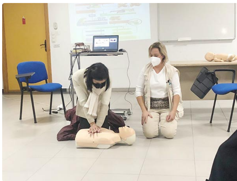
Un momento de las explicaciones

El Colegio Oficial de Enfermería de Córdoba continúa animando a todos los profesionales enfermeros de la provincia a sumarse a esta iniciativa, para la que tan solo es necesario motivación para ser parte del cambio y disponer de un poco de tiempo para acciones de voluntariado. Los enfermeros interesados pueden informarse en el email cordoba@solidaridadenfermera.org o en el teléfono del colegio cordobés 957 29 75 44. ■