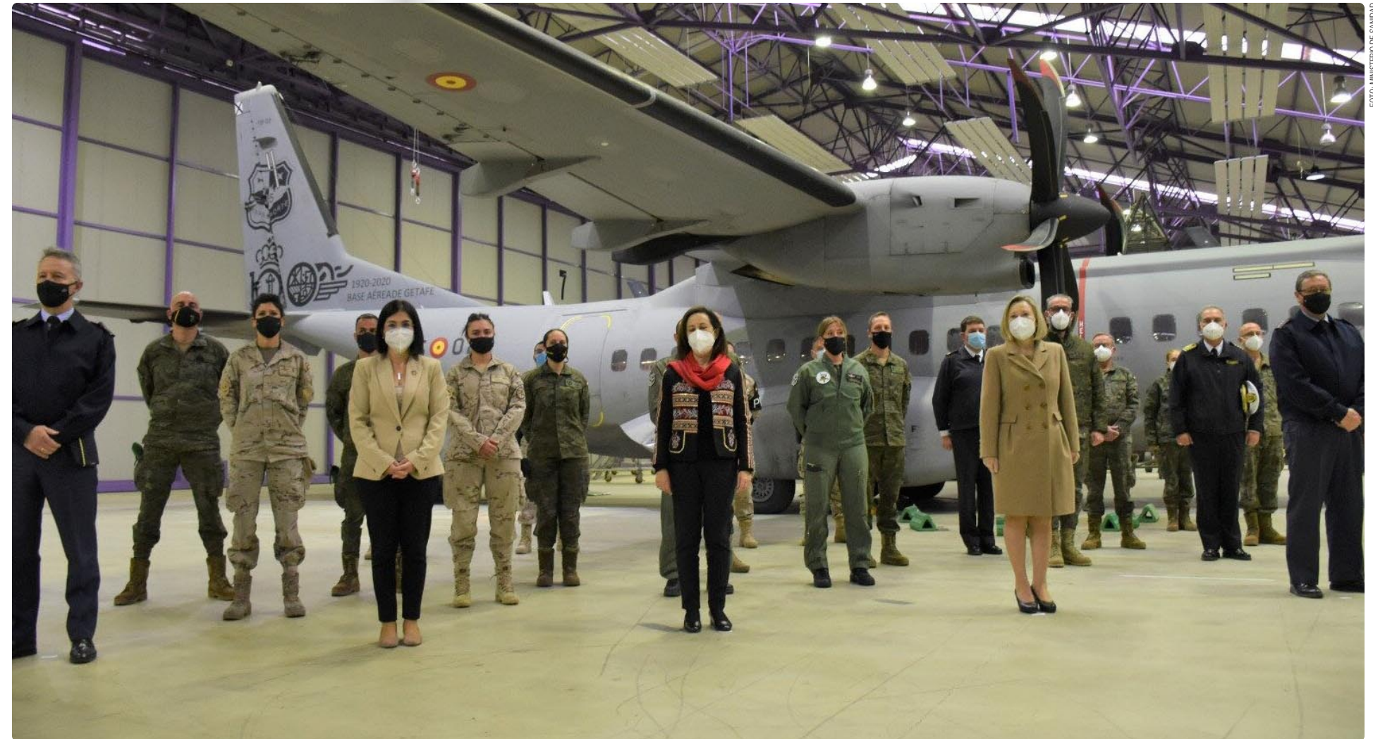
Visita de la ministra de Sanidad, Carolina Darias, a la base aérea de Getafe (Madrid)

Así, el Ministerio asignó 50 equipos de vacunación móviles para Andalucía; cinco para Aragón; uno para el Principado de Asturias; 10 para