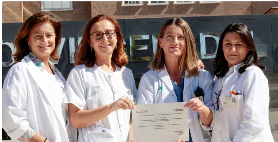
Las enfermeras ganadoras del Premio en el 44 Congreso de la SAEDYN

Las cinco enfermeras han reflejado la educación terapéutica estructurada que ofrecen a pacientes en el debut de su enfermedad en el Hospital de Día de Diabetes