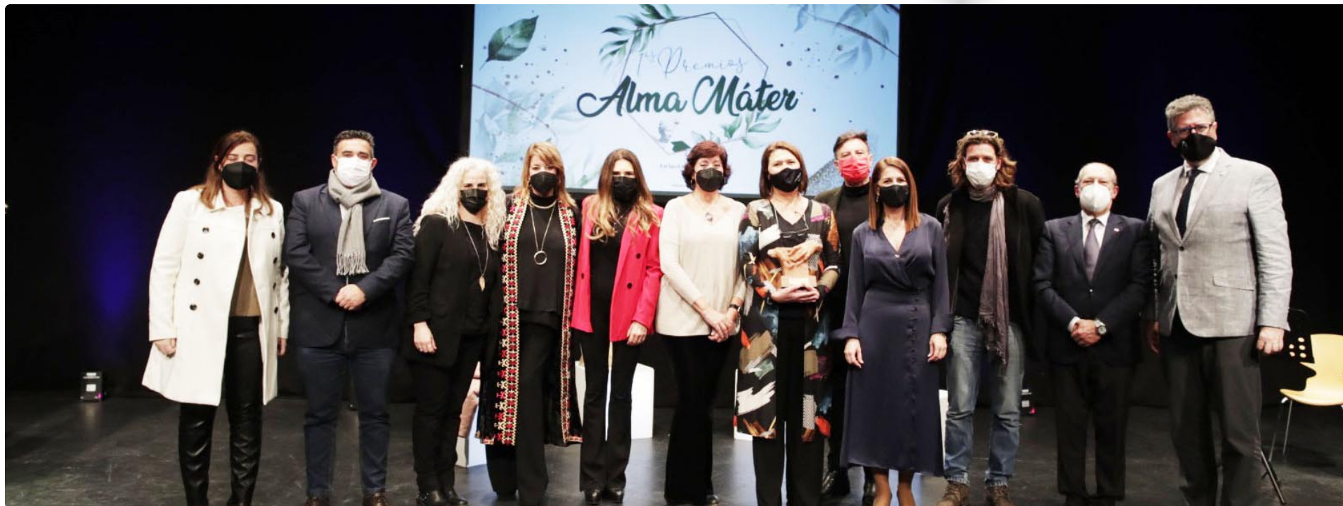
Fotografías del acto de entrega del I Premio "Alma Mater Creando Puentes"