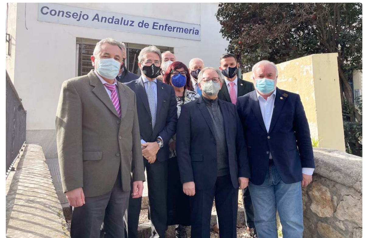
Representantes varios durante la firma del convenio con la Fundación INDEX

La Fundación Index es una entidad científica de reconocido prestigio internacional que, desde los años 80, viene trabajando en la gestión del conocimiento enfermero, desarrollando líneas y grupos de investigación, generando bases de datos bibliográficas, realizando actividades formativas y, en definitiva, promoviendo la investigación científica orientada a la enfermería y al componente cultural de los cuidados y la humanización de la salud. ■