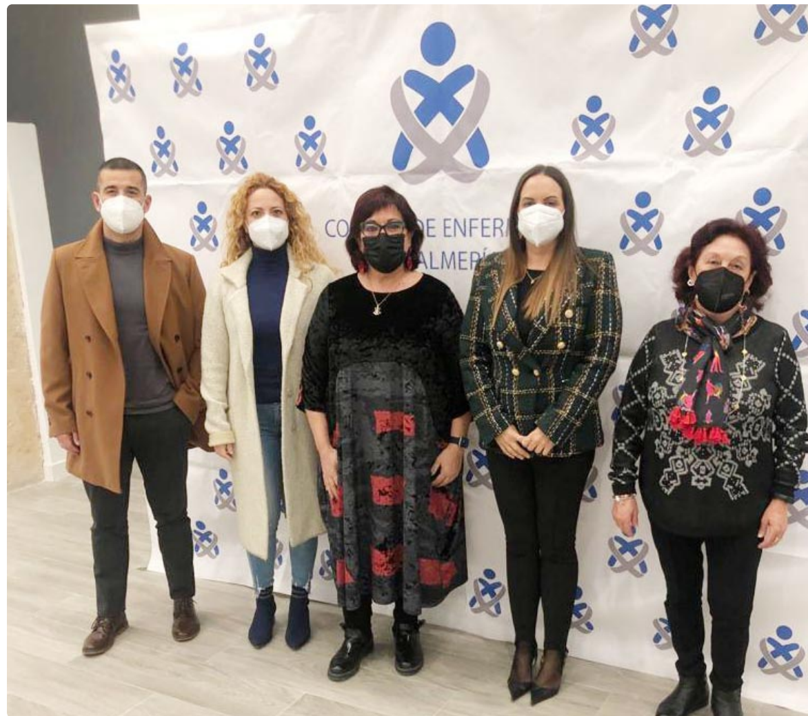
Fotografía de la Junta Directiva del Colegio de Enfermería de Almería

Sin ninguna duda, un cambio que servirá de catalizador para el Colegio y que potenciará a la profesión y a sus colegiados con el fin de mejorar en materia de salud y de cuidados del paciente. La nueva sede será inaugurada de manera oficial después del verano, para poder acompañar el acto de inauguración con distintas actividades durante varios días para permitir la asistencia de todos los que lo deseen, que supondrá el culmen a una dura tarea con años de mucho esfuerzo y trabajo. ■