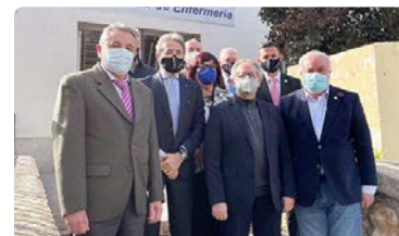
Las enfermeras andaluzas, comprometidas con la investigación