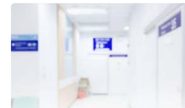
Reunión de trabajo para mejorar los cuidados ofrecidos en Atención Primaria