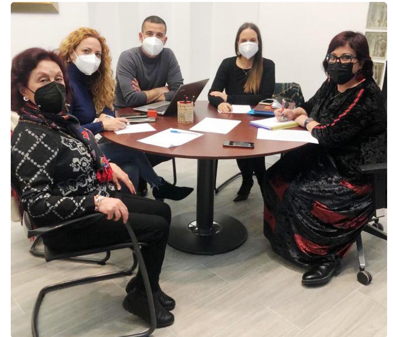
Junta Directiva reunida en la nueva sede del Colegio

Por otro lado, el tono de preocupación en el seno del Colegio Oficial de Enfermería de Almería es notable debido a los resultados de la encuesta sobre el estado de la profesión que, recientemente, ha publicado el Consejo General de Enfermería de España: “Esa encuesta ha puesto de manifiesto con datos numéricos lo que venimos denunciando desde hace mucho tiempo desde el Colegio de Enfermería de Almería y desde el Consejo And-