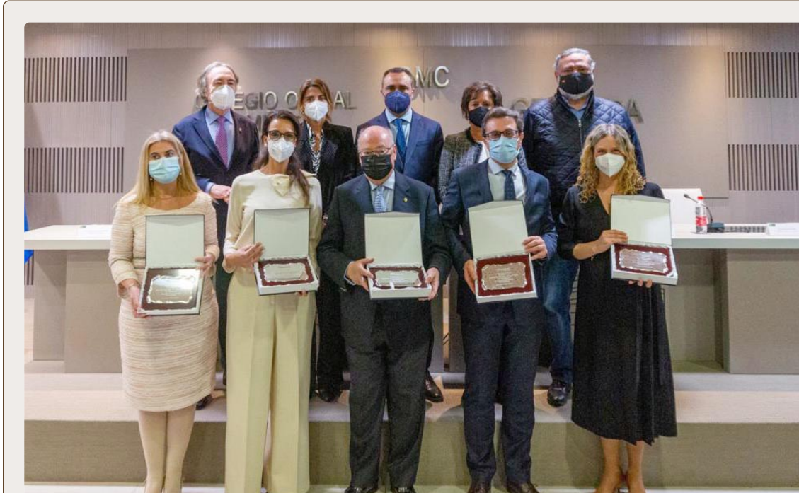
La viceconsejera de Salud y Familias, Catalina García ha presidido un acto de reconocimiento a la labor de los profesionales del ámbito sanitario que combaten la pandemia, organizado por el PP, un homenaje en el que ha participado el Colegio de Enfermería para representar a todos sus compañeros.

La suscripción en este canal es voluntaria y puede hacerse desde la web del Colegio -www.codegra.es-, la gestión del servicio respeta la normativa de protección de datos y darse de baja es igual de sencillo y rápido que gestionar el alta. ■