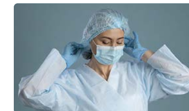
El CAE recuerda que la denominación de enfermería debe cuidarse