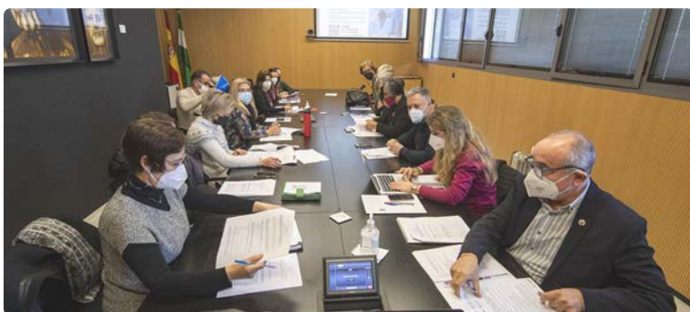
El Colegio de Granada durante la celebración de las anteriores jornadas de enfermería