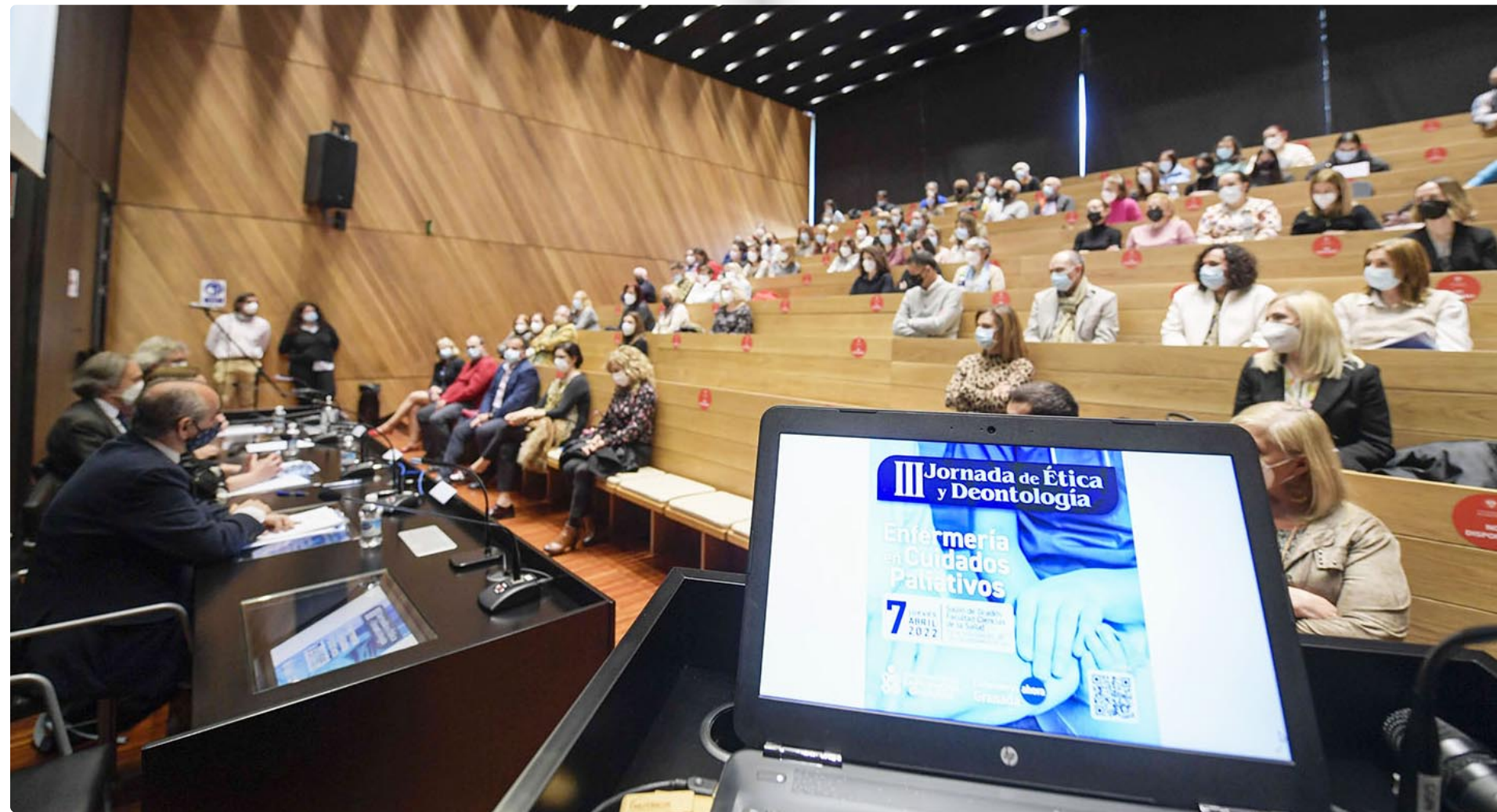
Fotografía tomada durante la celebración de las III Jornadas de Ética y Deontología

El Colegio de Enfermería de Granada mantiene su apuesta por la ética y la deontología con cursos de formación especializada, un ciclo de cine que aprovecha la filmografía nacional y extranjera para abordar temas conflictivos y un servicio de asesoramiento, entre otras propuestas. ■