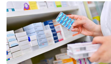
Andalucía implementa un nuevo proyecto de educación sanitaria sobre el uso de tranquilizantes