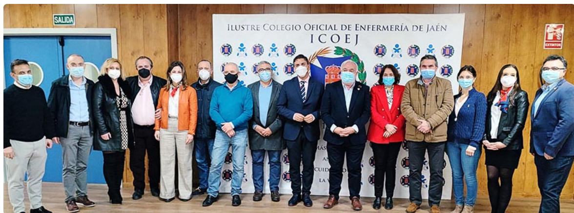
Miembros del jurado del Certamen Nacional de Investigación formado por responsables de centros sanitarios, responsables de formación de Atención Primaria y Especializada, de la Universidad de Jaén y la UNED