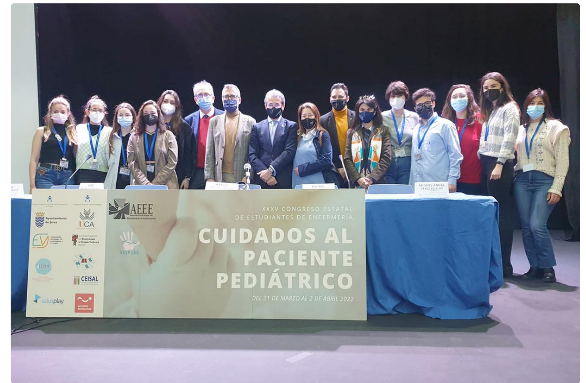
Participantes del Congreso celebrado en Jerez de la Frontera.

en primera línea, hemos tenido la oportunidad de encontrarnos. Cádiz fue elegida sede, la organización del congreso ha sido complicada, pero hemos logrado que casi dos centenares de estudiantes se hayan reunido para formarse en enfermería pediátrica. Los niños tienen que una enorme capacidad de comunicación, una resiliencia envidiable, una fortaleza bestial y todo junto la inocencia más tierna. Hoy estamos aquí porque sabemos que formarnos nos hace mejores profesionales y eso nos ayuda a ser mejores con nuestros ▶