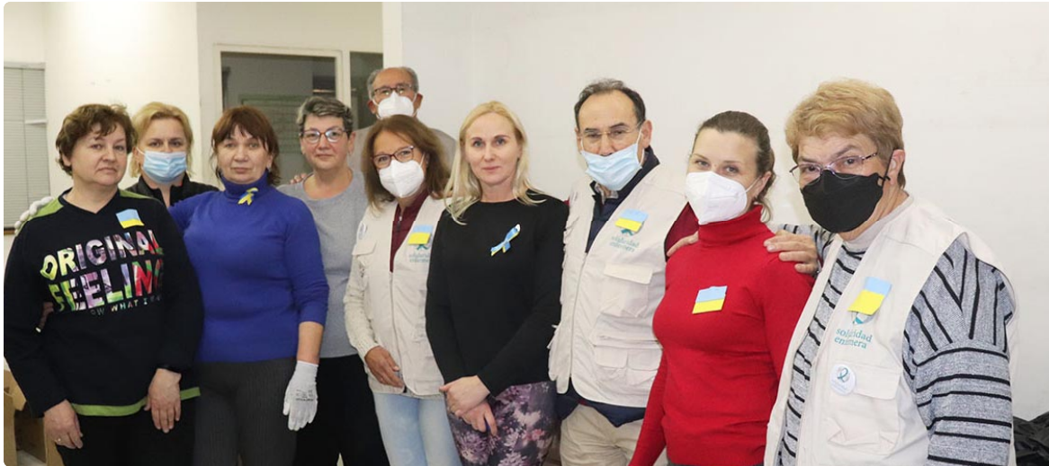
Enfermeros voluntarios junto a integrantes de la comunidad ucraniana cordobesa