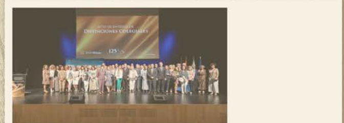
Los colegiados de enfermería en la entrega de insignias a la dirección de la institución

Reconoce el trabajo y la entrega de aquellos miembros que han cumplido 50 y 25 años en la profesión