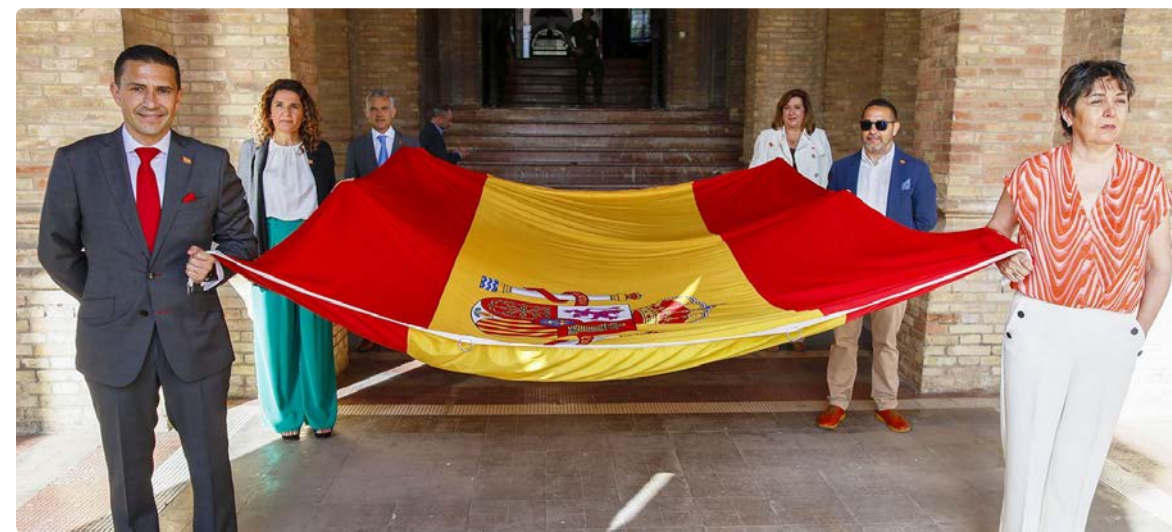
Algunos de los miembros de la Junta de Gobierno del ECOES portando la bandera para su posterior izado en el Cuartel General Fuerza Terrestre del Ejército de Tierra