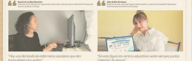
"Hay una demanda de enfermeras escolares que den tranquilidad a los padres"