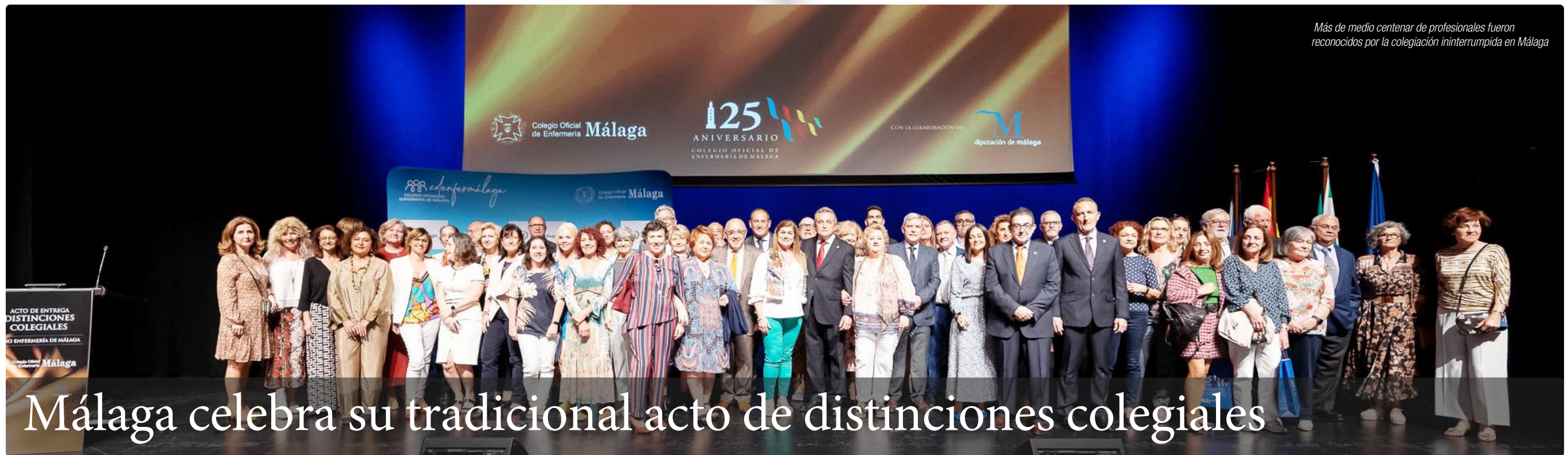
Más de medio centenar de profesionales fueron reconocidos por la colegiación ininterrumpida en Málaga