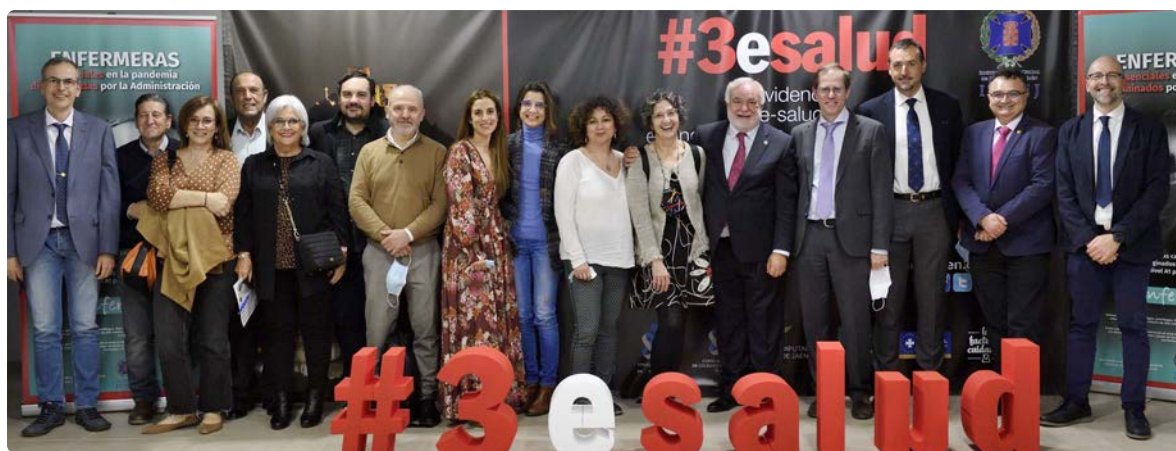
Responsables del ICOEJ junto a ponentes y participantes

En cuanto al número de matronas en estos momentos en activo, la provincia cuenta con 86: 12 matronas en Úbeda; 13 en Linares; 36 en el Hospital Materno-Infantil de Jaén; 11 en el Distrito Sanitario Jaén-Jaén Sur; 5 en el Distrito Jaén Norte y 9 en Distrito Nordeste.