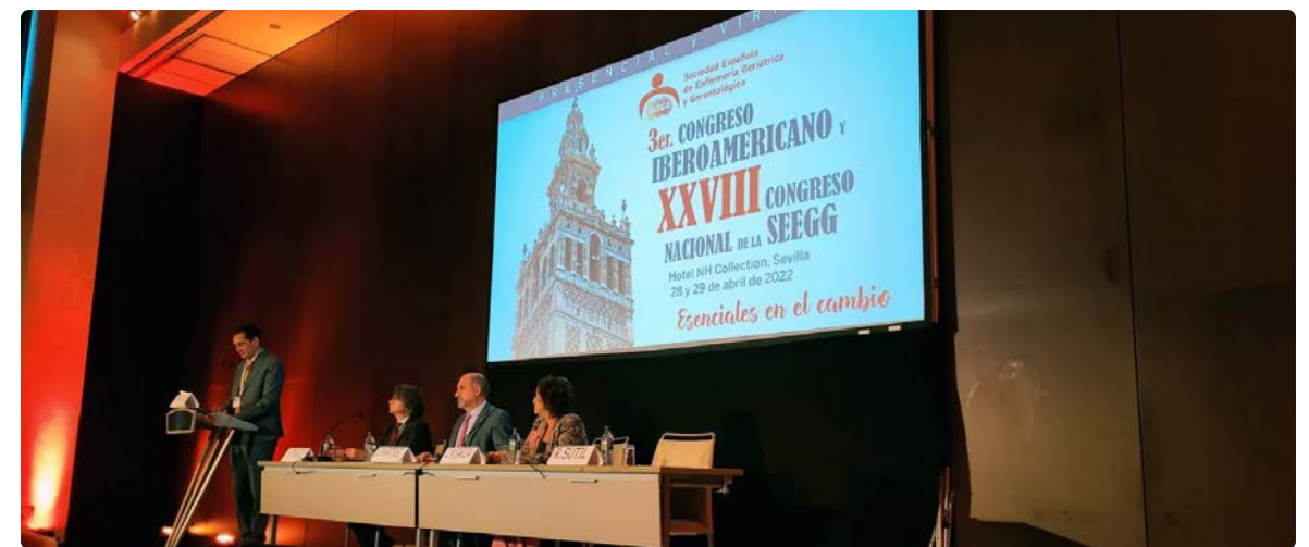
Fotografía tomada durante el acto de clausura del Congreso