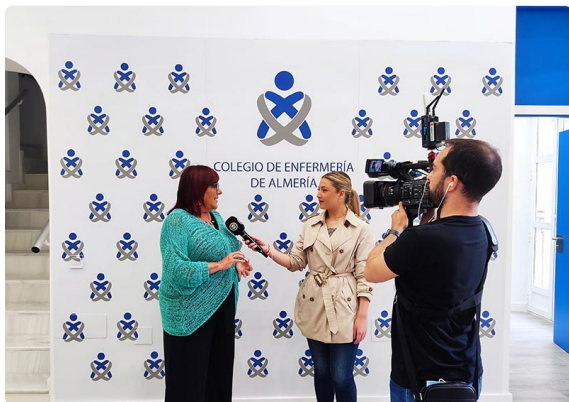
InterAlmería en la nueva sede colegial