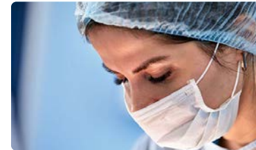
La profesión dice NO a la FP Sociosanitaria propuesta por el Gobierno