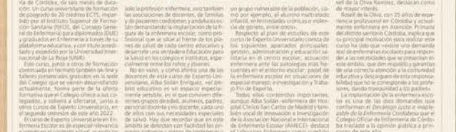
Un grupo de enfermeras en un curso de formación