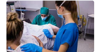
Rechazo del CAE a las convocatorias de cargos intermedios del SAS