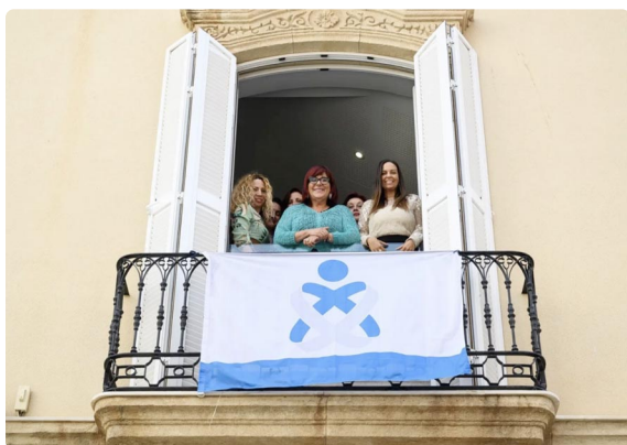
Bandera de Enfermería en las nuevas instalaciones del COE Almería