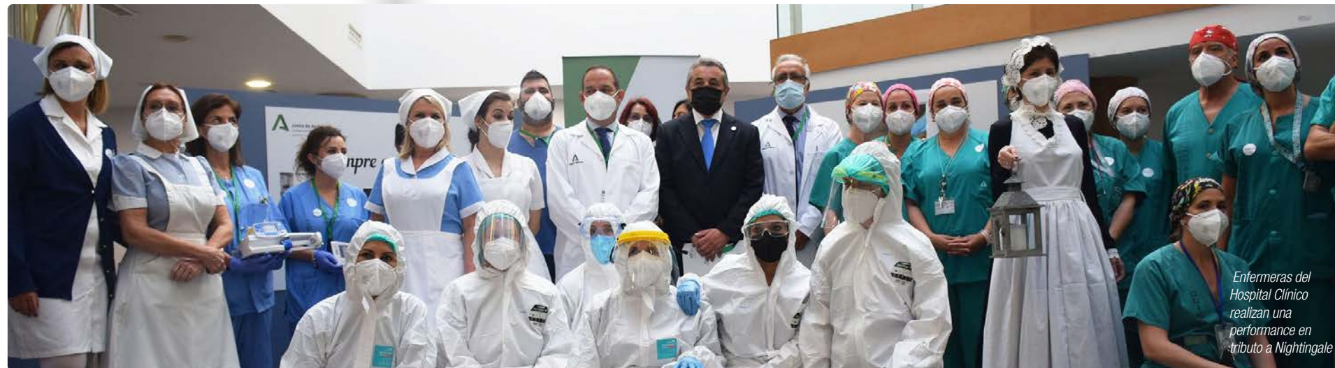
Enfermeras del Hospital Clínico realizan una performance en tributo a Nightingale

En añadido, el presidente de las más de 8.000 colegiadas de Málaga ha trasladado el mayor de los reconocimientos a la profesión, además de un cálido agradecimiento al Hospital por visibilizar y dar voz a la labor del colectivo enfermero. "Desde hace más de un siglo, la Enfermería ha caminado por el sendero de los cuidados demostrando excelencia, compromiso y una enorme valía social. Por eso, para este Colegio es un orgullo poder celebrar el Día Internacional de la Enfermería cerca de nuestros compañeros, rindiendo tributo al papel que el colectivo viene desarrollando en la protección y promoción de la salud de los malagueños y malagueñas".