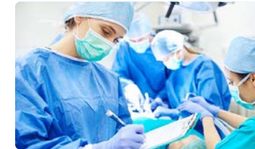
Andalucía implementa un nuevo proyecto de educación sanitaria sobre el uso de tranquilizantes