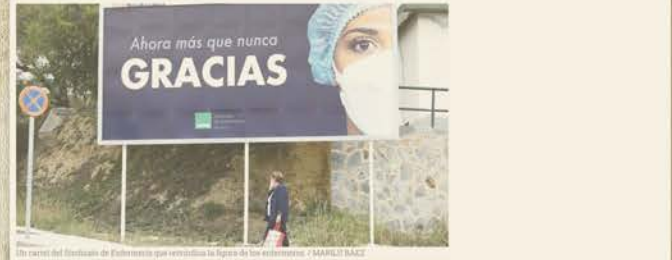
El sector del Hospital de Enfermería que reivindica la figura de los enfermeros

El Consejo Andaluz de Enfermería ha puesto 48 recursos y amenaza con la impugnación