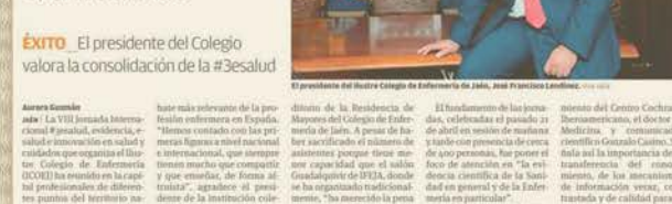
El presidente del Colegio valora la consolidación de la #3esalud