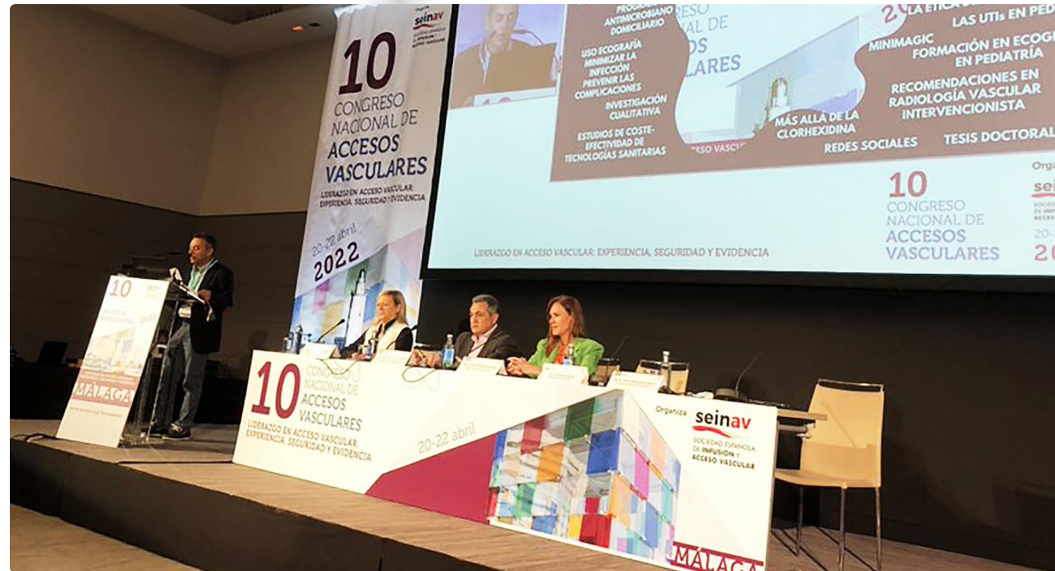
Mesa de clausura del 10º Congreso Nacional de Accesos Vasculares en la que participa el presidente del CAE

Antequera. “La idea de implementar esta iniciativa surge aproximadamente hace cuatro años bajo el objetivo de mejorar las competencias enfermeras y promover la educación sanitaria del paciente. Desde el ámbito asistencial identificamos una carencia en el manejo de los dispositivos venosos. En concreto,