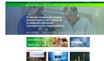
La Enfermería andaluza estrena nueva página web