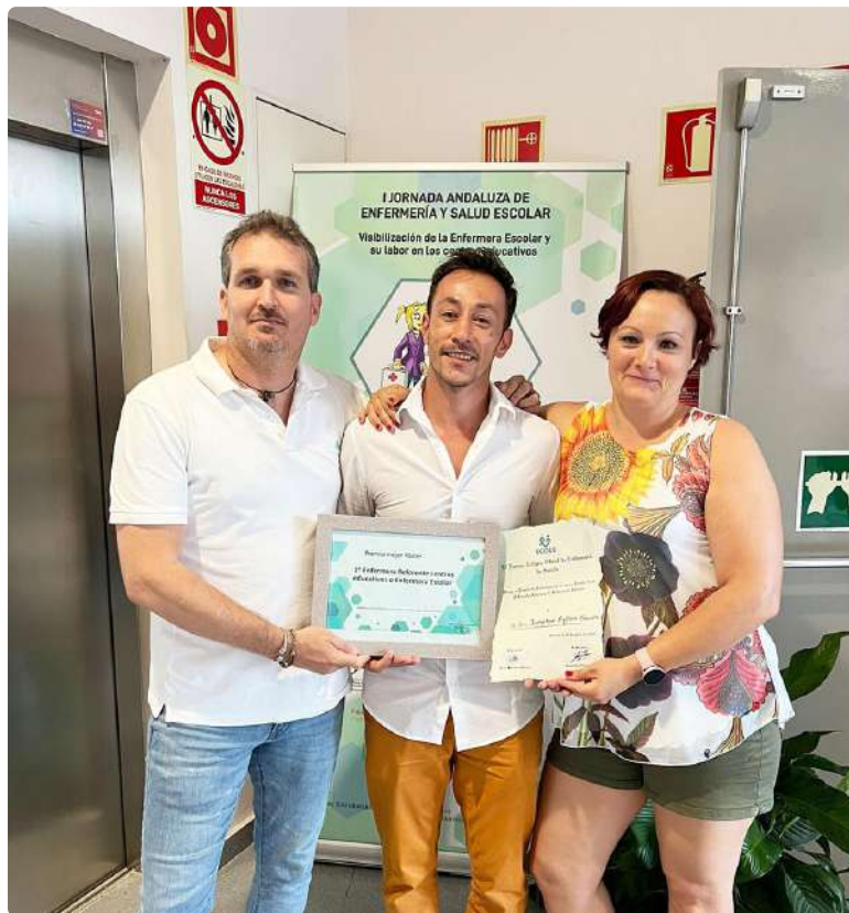
Colegiados de Andalucía, reconocidos en el acto de clausura de las jornadas

El encuentro se ha consolidado como una cita de grandes profesionales comprometidos con la ciudadanía para continuar avanzando en la construcción de una comunidad plagada de salud y bienestar