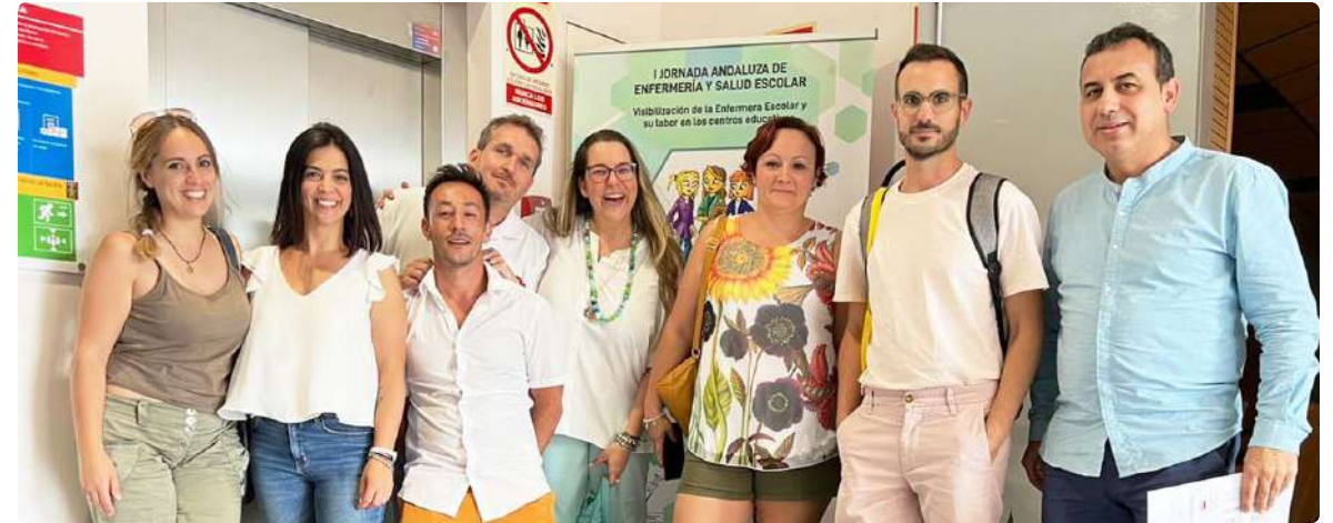
Colegiados de Andalucía, reconocidos en el acto de clausura de las jornadas

vertirse en agentes activos en salud. “Deseamos una transversalidad educativa en conocimiento y práctica en salud, con todos los recursos que envuelven y caracterizan a los