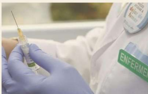
Una enfermera prepara una inyección

Andalucía busca cientos de sanitarios para el verano con las bolsas de Enfermería vacías