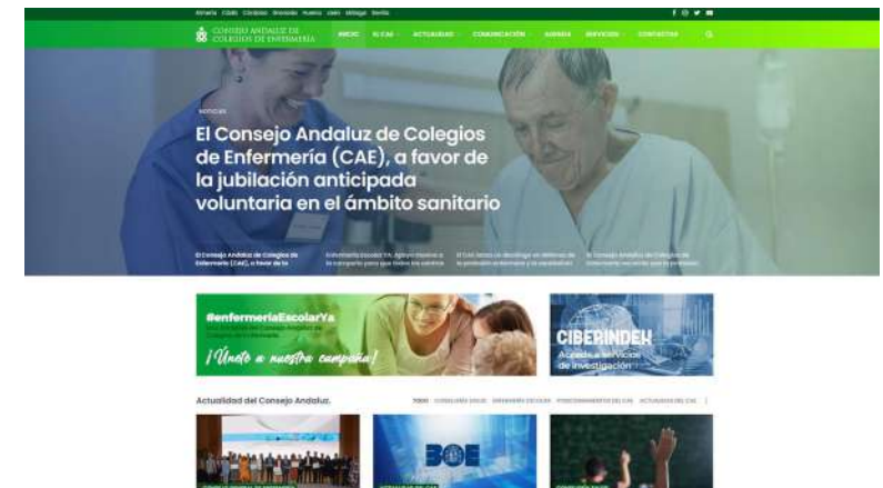
Nuevo espacio digital del Consejo Andaluz de Colegios de Enfermería

“Queremos un consejo abierto, operativo y transparente”