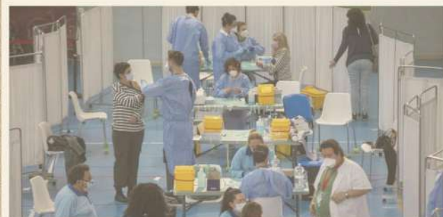
Imagen de archivo de sanitarios andaluces durante la primera fase de la vacunación contra la covid.

El Plan de Verano del SAS se queda sin relevo. La Junta ha lanzado una convocatoria de 18.000 contratos señalando que el personal en bolsa "se ha agotado" para cubrir las vacaciones del personal