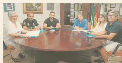
Un instante del encuentro celebrado en la sede del Colegio de Enfermería de Cádiz.

El colectivo se reunió con el Colegio de Enfermería para informarle sobre sus reivindicaciones