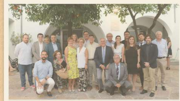
Doctores asistentes y representantes institucionales

El Colegio hace entrega de la Insignia de Plata de la Organización Colegial y del nuevo carnet colegial de Doctor en Enfermería a todos los colegiados que han alcanzado el título de Doctor