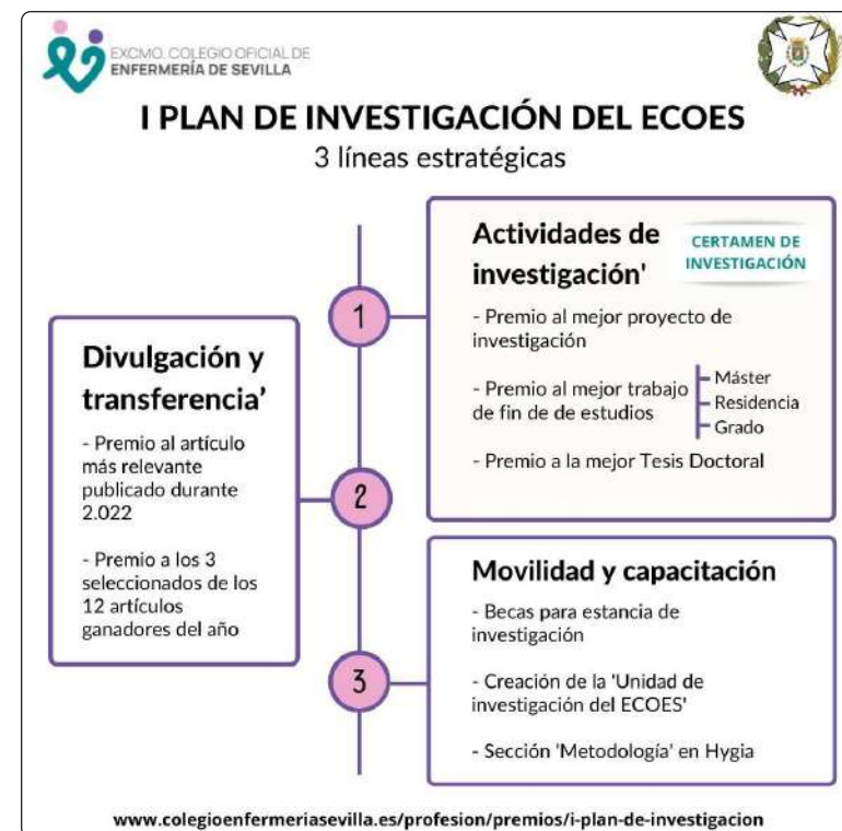
Líneas estratégicas del I Plan de Investigación del ECOES (IPI-ECOES)

La primera línea estratégica, ‘Estímulo de las actividades de investigación’, a través del ‘Certamen de Enfermería basada en la Evidencia y Estímulo a la Investigación’ ofrece tres premios diferentes a las enfermeras colegiadas: Premio al mejor Proyecto de Investigación enfermera, Premio al mejor trabajo fin de estudios y Premio a la mejor Tesis doctoral . El plazo de presentación finaliza el 31 de octubre y el fallo se conocerá el 15 de diciembre.