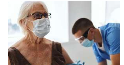
Razones para implantar la jubilación anticipada voluntaria en el ámbito sanitario