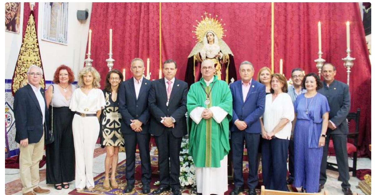
Miembros de la Junta de Gobierno del Colegio Oficial de Enfermería de Málaga durante la celebración de la misa conmemorativa celebrada por parte de la Hermandad del Rescate con motivo del 125 aniversario fundacional