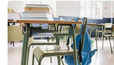
Andalucía secunda la campaña Enfermería Escolar YA!