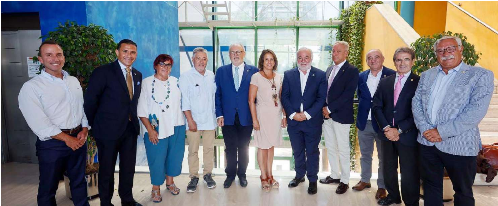
Fotografía tomada durante la celebración de la reunión entre el CAE y Catalina García, Consejera de Salud