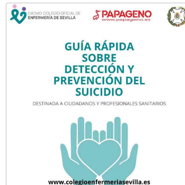
Imagen publicada en redes sociales sobre el Día Mundial sobre la Prevención del Suicidio