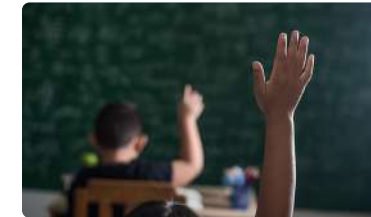
Andalucía en la vuelta al cole, sin enfermeras escolares