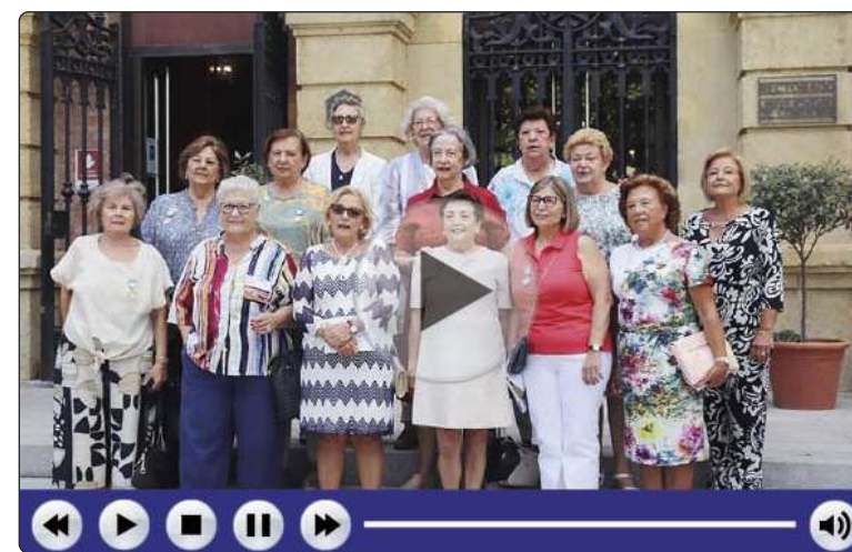
Si no puede ver el video correctamente pinche aquí

"Para el Colegio Oficial de Enfermería de Córdoba es un honor celebrar vuestro 50 Aniversario, por lo que habéis supuesto para la sanidad cordobesa y para vuestro Colegio. (...) Enhorabuena y muchas gracias por haber dado tanto a tantos", concluyó Castillo. ■