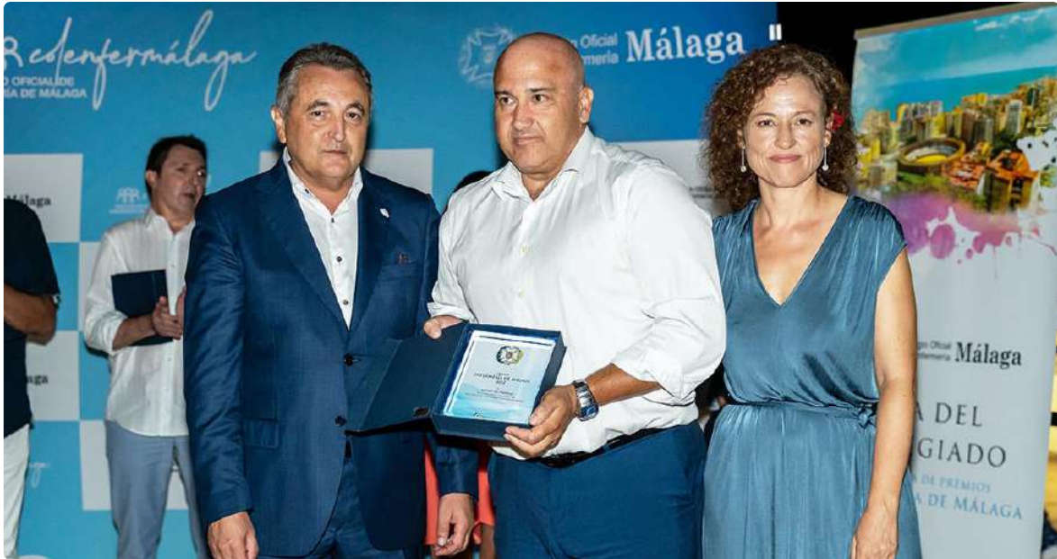
El presidente del Colegio Oficial de Enfermería de Málaga, junto a la vicepresidenta, durante la entrega de premios