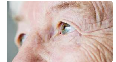
La preocupante falta de enfermeras en las residencias andaluzas