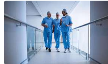
Jubilación anticipada voluntaria para la Enfermería