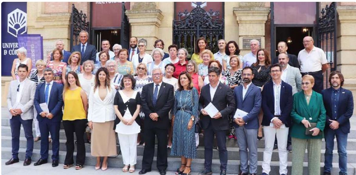
Homenajeadas, asistentes y autoridades presentes en el acto.