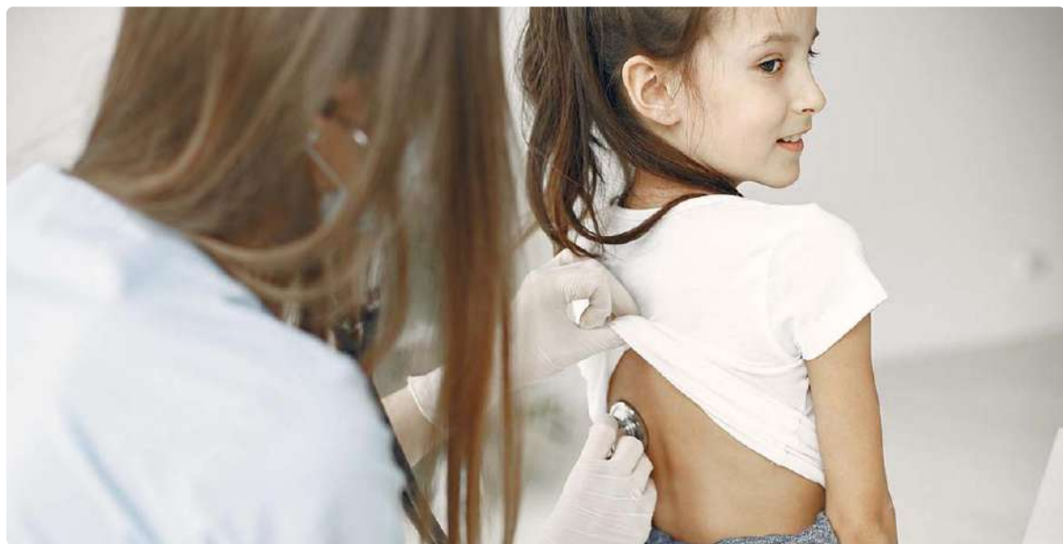
Enfermero atendiendo a un menor

En países como Francia, Reino Unido, Suecia o Noruega los alumnos ya cuentan con servicio de Enfermería escolar para cubrir la atención sanitaria a patologías, asistencia inmediata, prevención y promoción de la salud. ■